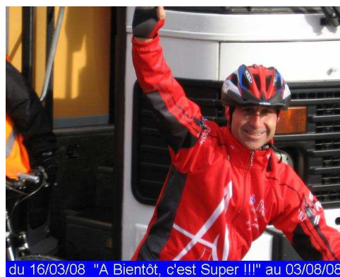
du 16/03/08 "A Bientôt, c'est Super !!!" au 03/08/08